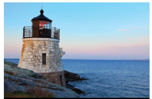
photo: Boston, MA—Il Boston Common in autunno Newport, MA—Il faro di Castle Hill al tramonto