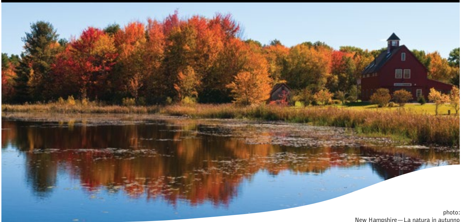
photo: New Hampshire—La natura in autunno

8 giorni / 7 notti. Tutto l'anno. Inizio/Fine tour: Boston, MA