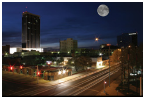
photo: Austin, TX — Panorama notturno Amarillo, TX — Panorama notturno