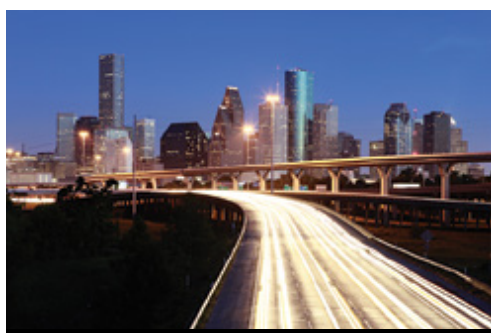
photo: Austin, TX—La città e il fiume Colorado Houston, TX—Panorama