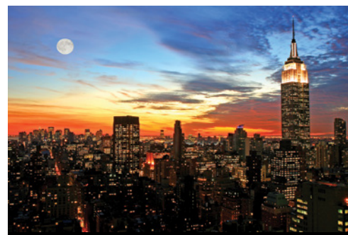
photo: Philadelphia—La torre dell'orologio della City Hall New York—Panorama al tramonto