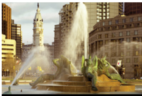
photo: Gettysburg, PA—Lo storico campo di battaglia Philadelphia, PA—La Swann Memorial Fountain