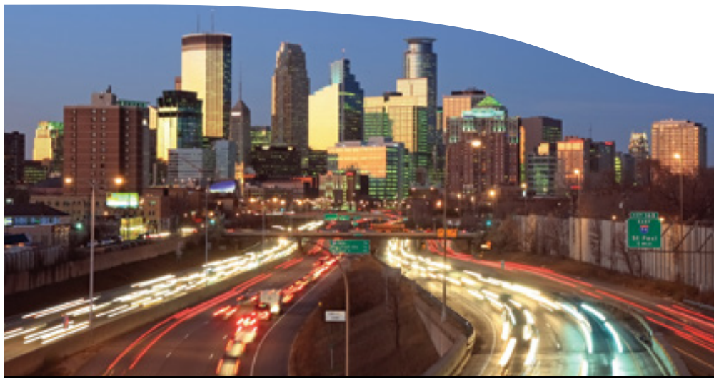
photo: Minneapolis, MN—Panorama

Noleggio auto: negli itinerari self proponiamo una vettura di categoria Full Size allo stesso prezzo delle Intermedie, in virtù degli accordi con i nostri partner commerciali. Auto di categoria economy o compact, infatti, mettono spesso in difficoltà con i bagagli anche solo 2 passeggeri. I nostri uffici sono a vostra disposizione per quotarvi diverse tipologie di vetture (Suv, Minivan, Cabrio, ecc.).