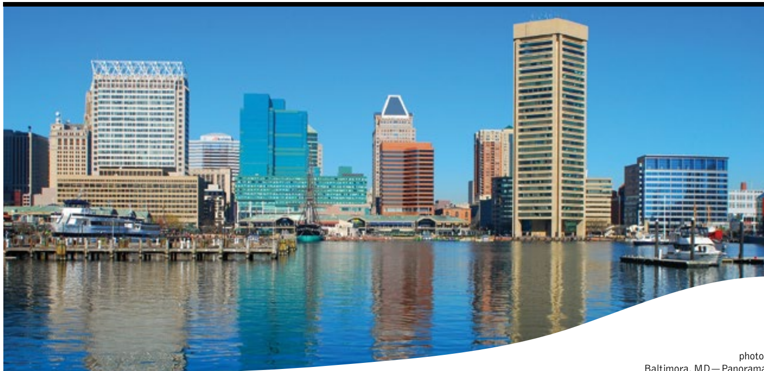
photo: Baltimore, MD—Panorama

8 giorni / 7 notti. Da aprile a ottobre. Inizio/Fine tour: Washington, D.C.