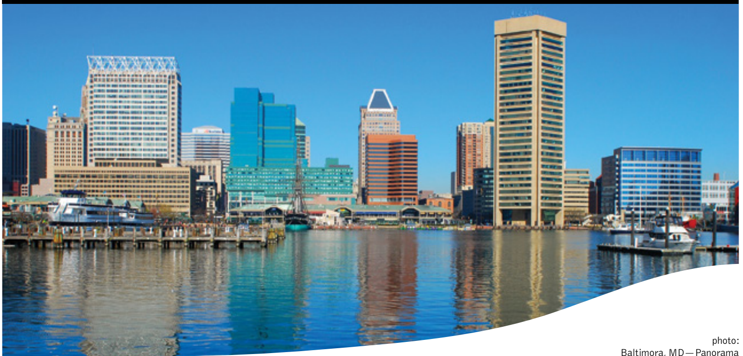
photo: Baltimore, MD—Panorama

8 giorni / 7 notti. Da aprile a ottobre. Inizio/Fine tour: Washington, D.C.