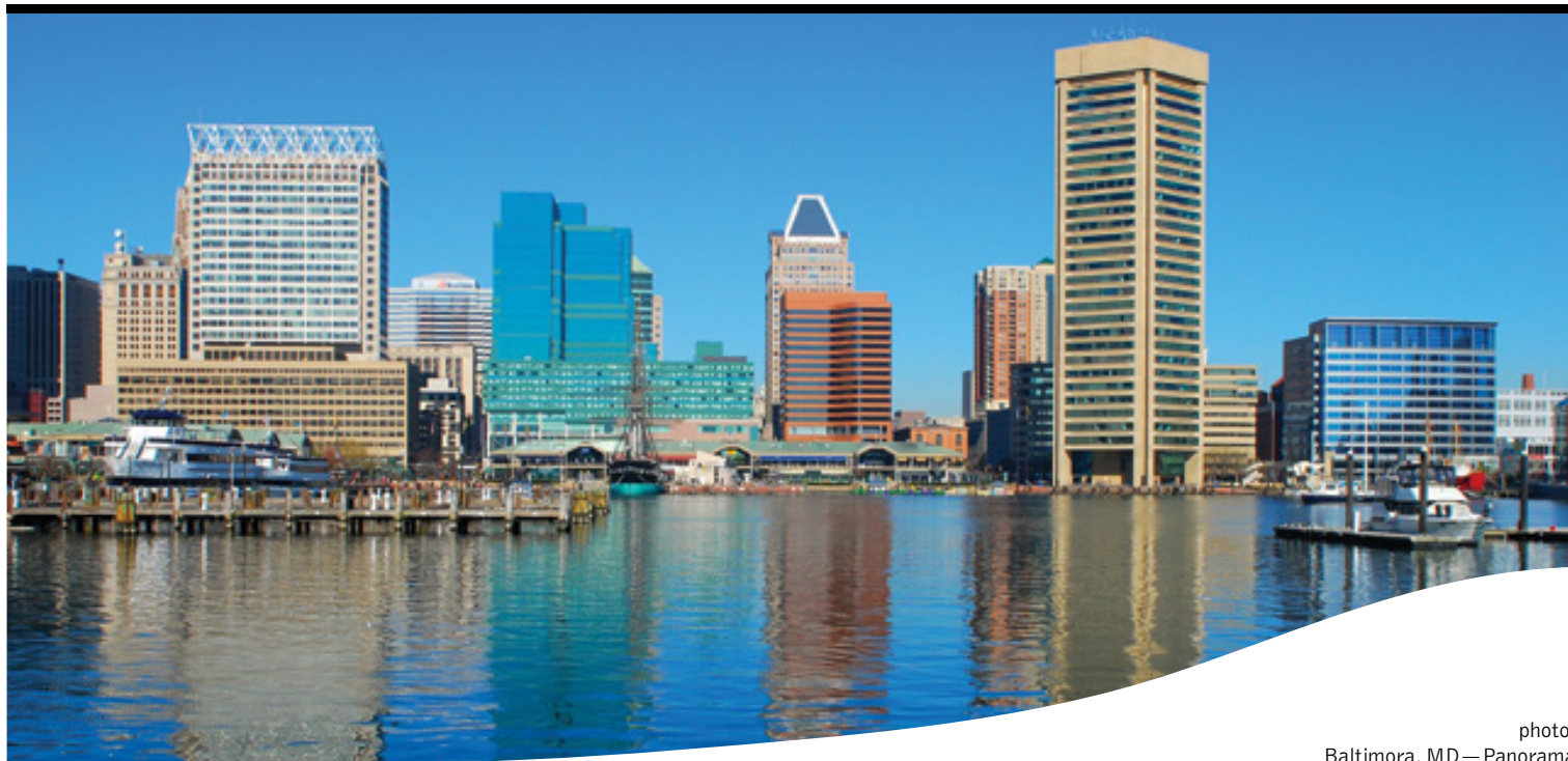
photo: Baltimore, MD—Panorama

8 giorni / 7 notti. Da aprile a ottobre. Inizio/Fine tour: Washington, D.C.