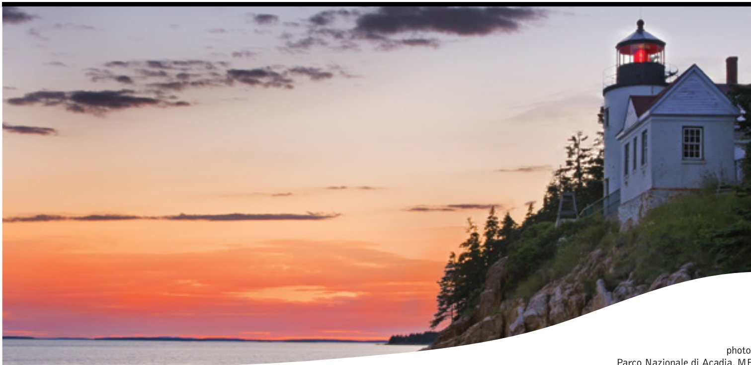
photo: Parco Nazionale di Acadia, ME

12 giorni / 11 notti. Tutto l'anno. Inizio/Fine tour: Boston, MA