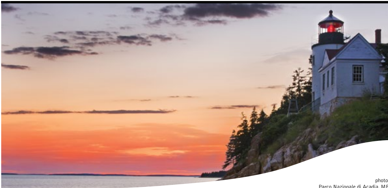
photo: Parco Nazionale di Acadia, ME

12 giorni / 11 notti. Tutto l'anno. Inizio/Fine tour: Boston, MA