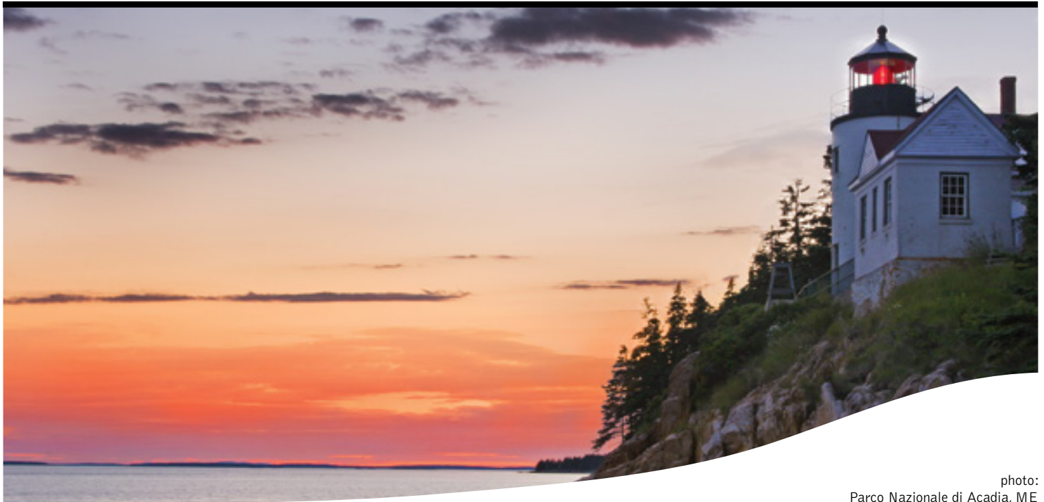
photo: Parco Nazionale di Acadia, ME

12 giorni / 11 notti. Tutto l'anno. Inizio/Fine tour: Boston, MA