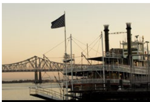
photo: New Orleans, LA—La città vecchia New Orleans, LA—Il fiume Mississippi