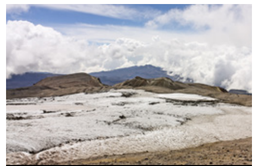
photo: Valle del Cocora—Panorama Parco Nazionale Los Nevados—Panorama