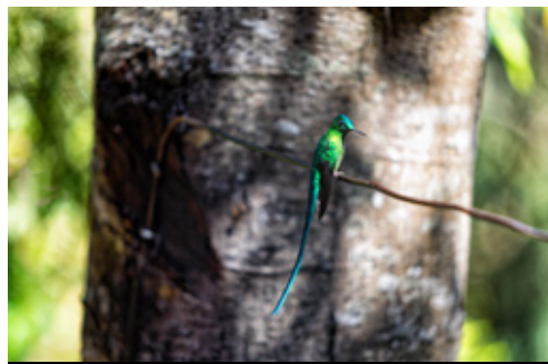
photo: Parco Nazionale Los Nevados—Panorama Santuario dei Colibri—Un esemplare verde smeraldo