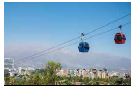
photo: San Pedro de Atacama—Panorama Santiago de Chile—Panorama