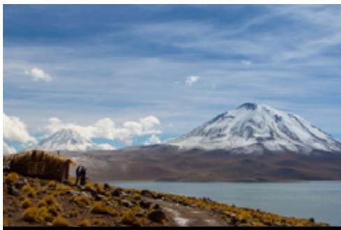
photo: Santiago de Chile—Plaza de Armas San Pedro de Atacama—Panorama