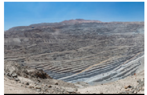
photo: San Pedro de Atacama—Panorama Miniera di Chuquicamata, Calama—Panorama