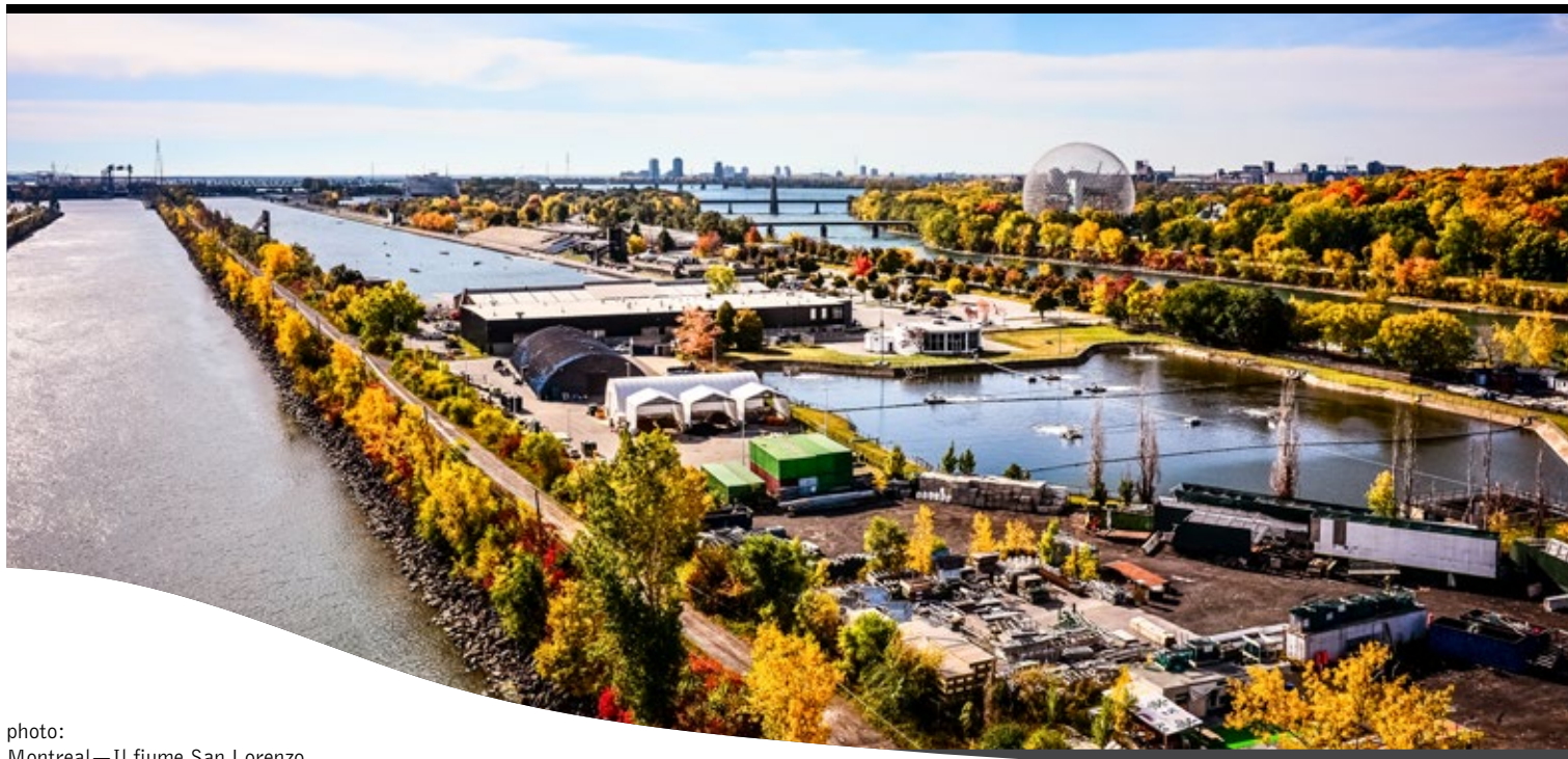
photo: Montreal—Il fiume San Lorenzo

8 giorni / 7 notti. Da maggio a ottobre. Inizio/Fine tour: Montreal/Toronto