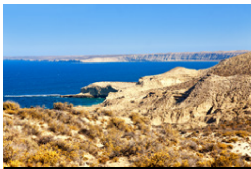
photo: Quebrada de Cafayate – Panorama Penisola di Valdez – Panorama