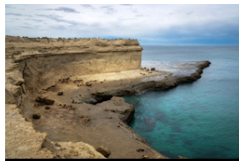
photo: Buenos Aires—Caminito street, distretto di La Boca Penisola di Valdez—Panorama