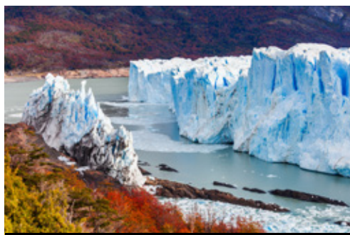
photo: Quebrada de Cafayate—Panorama Perito Moreno—Los Glaciares National Park